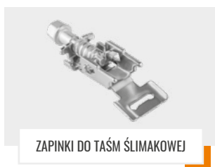
ZAPINKI DO TAŚM ŚLIMAKOWEJ