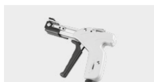
ZACISKARKA DO OPASEK STALOWYCH